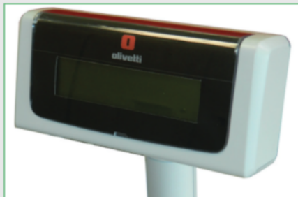
Display cliente grafico remotizzato