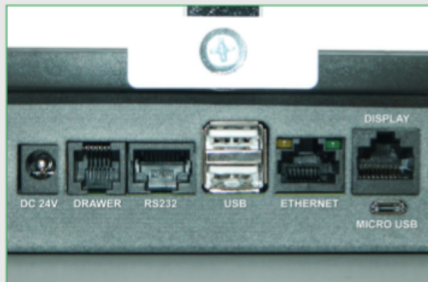
Ampia disponibilità di connessioni